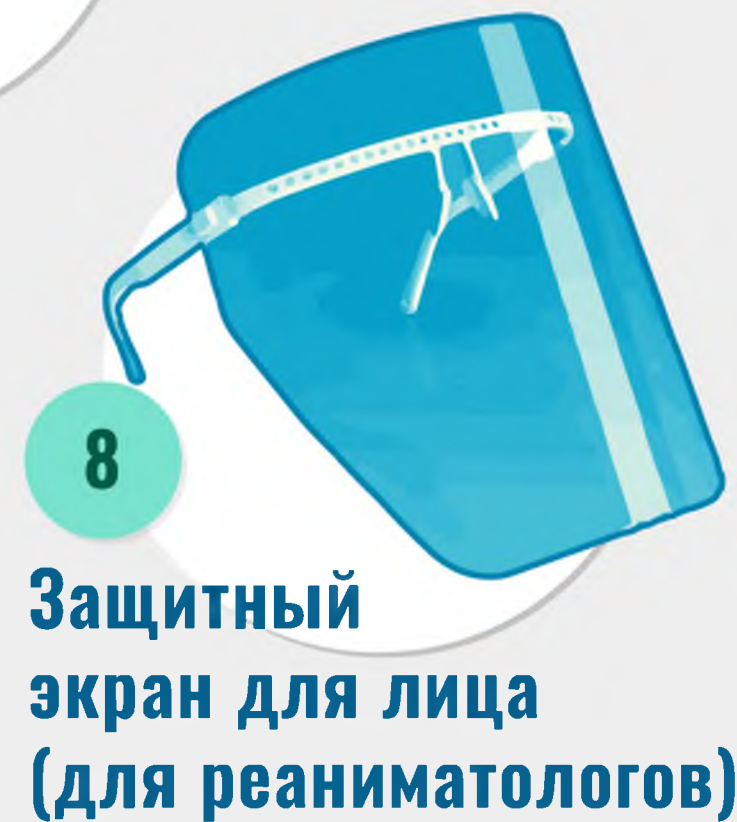
8 Защитный экран для лица (для реаниматологов)