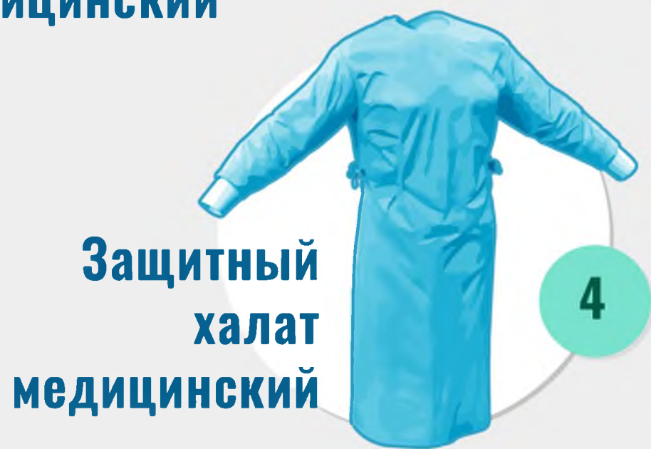
4 Защитный халат медицинский