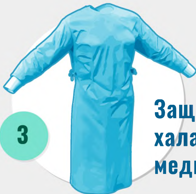
Защитный халат медицинский