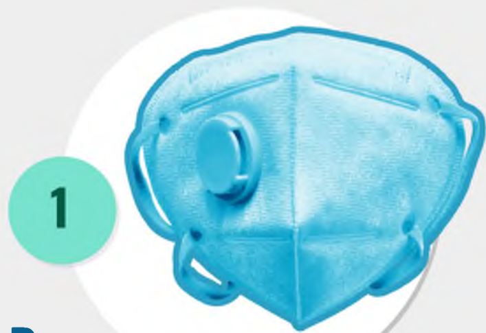
1 Респиратор медицинский