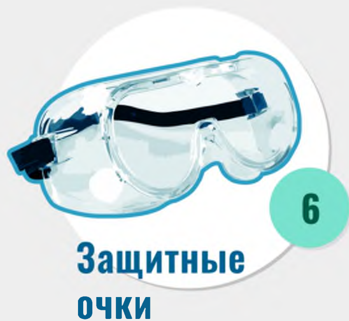
6 Защитные очки