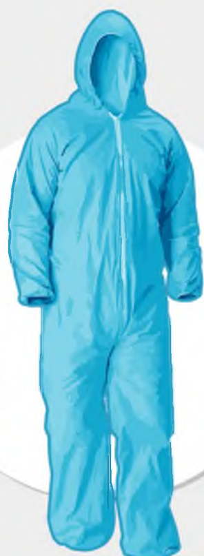
Защитный комбинезон/ костюм