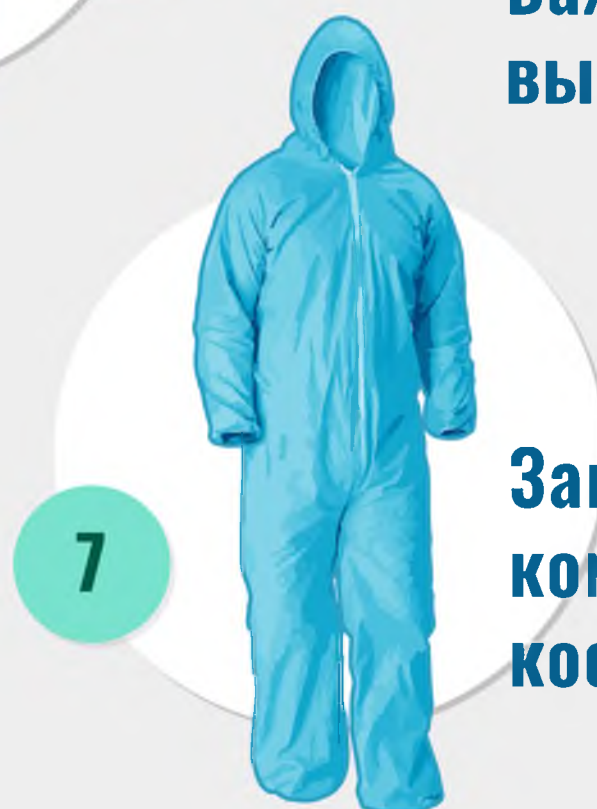
7 Защитный комбинезон/ костюм