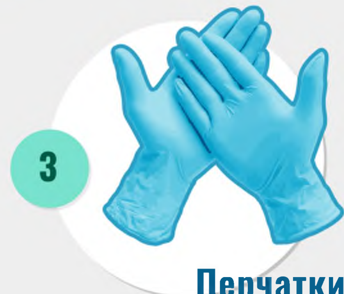
3 Перчатки медицинские