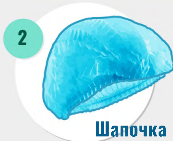
2 Шапочка медицинская