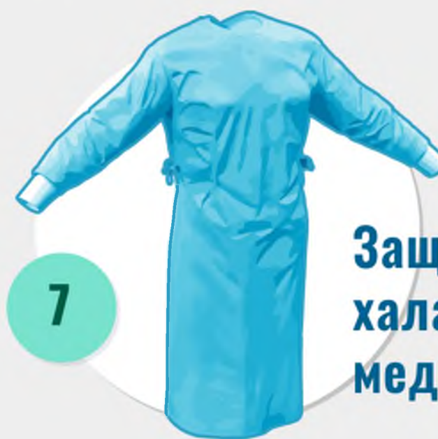
Защитный халат медицинский